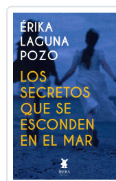
LOS SECRETOS QUE SE ESCONDEN EN EL MAR ERIKA LAGUNA POZO