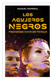
LOS AGUJEROS NEGROS PREFIEREN VIVIR EN PAREJA MANUEL MONREAL