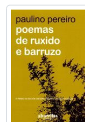
POEMAS DE RUXIDO E BARRUZO PAULINO PEREIRO