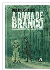
A DAMA DE BRANCO WILKIE COLLINS