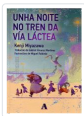
UNHA NOITE NO TREN DA VIA LACTEA KENJI MIYAZAWA