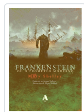
FRANKENSTEIN (TAPA DURA) MARY SHELLEY