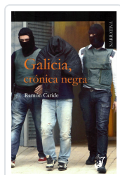
GALICIA, CRÓNICA NEGRA RAMÓN CARIDE