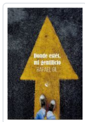
DONDE ESTES MI GENTILICIO RAFAEL GIL