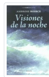
39. VISIONES DE LA NOCHE AMBROSE BIERCE