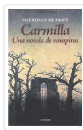
16. CARMILLA. UNA NOVELA DE VAMPIROS SHERIDAN LE FANU