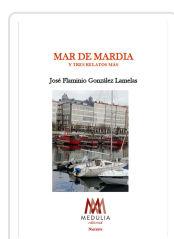
MAR DE MARDIA Y TRES RELATOS MÁS JOSÉ FLAMINIO GONZÁLEZ LAMELAS