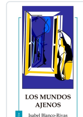
LOS MUNDOS AJENOS ISABEL BLANCO-RIVAS