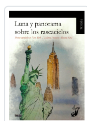
LUNA Y PANORAMA SOBRE LOS RASCACIELOS AA.VV.