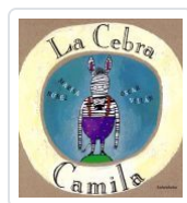
LA CEBRA CAMILA (26ª EDICIÓN) MARISA NUÑEZ; OSCAR VILLAN (ILU.)