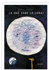
¿A QUÉ SABE LA LUNA? GREJNIEC, MICHAEL