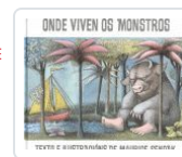
ONDE VIVEN OS MONSTROS MAURICE SENDAK