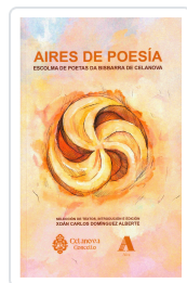
AIRES DE POESÍA AA.VV.