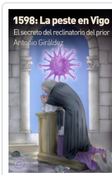
1598: LA PESTE EN VIGO ANTONIO GIRÁLDEZ