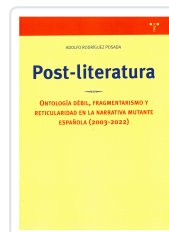
POST-LITERATURA ADOLFO RODRÍGUEZ POSADA