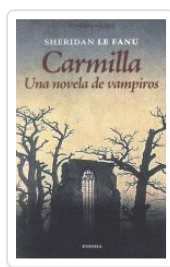
16.CARMILLA.UNA NOVELA DE VAMPIROS SHERIDAN LE FANU