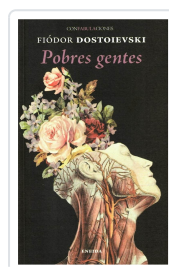
POBRES GENTES FIÓDOR DOSTOIEVSKI