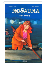
ROSAURA E O MAR ISABEL BLANCO