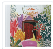
O XARDÍN DAS SETE PORTAS CONCHA CASTROVIEJO