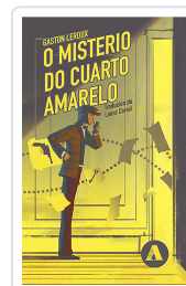
O MISTERIO DO CUARTO AMARELO LEROUX, GASTON