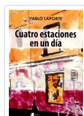
CUATRO ESTACIONES EN UN DÍA PABLO LAPORTE