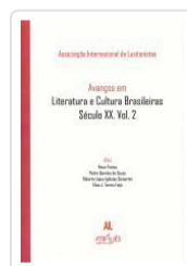
AVANÇOS EM LITERATURA E CULTURA BRASILEIRAS.SECULO XX.VOL.2 ASSOCIAÇÃO INTERNACIONAL DE LUSITANISTAS