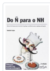
DO Ñ PARA O NH (2ªED) VALENTIM FAGIM