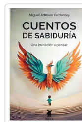
CUENTOS DE SABIDURIA ADROVEN CANDENTEY, MIGUEL