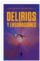
DELIRIOS Y ENSOÑACIONES JOSE ARCADIO MARIN ABDILLA