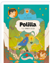
POLILLA Y EL CAMINO A LA ISLA BEA GREGORES