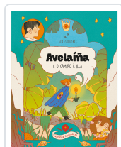
AVELAÍÑA E O CAMINO Á ILLA BEA GREGORES