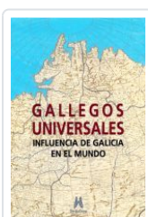
GALLEGOS UNIVERSALES VV.AA.: ALFONSO EIRE (COORD.)