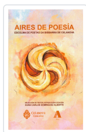
AIRES DE POESÍA AA.VV.