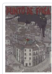
PUNTO DE FUGA MIGUEL CUBA