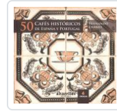
50 CAFES HISTÓRICOS DE ESPAÑA Y PORTUGAL FERNANDO FRANJO