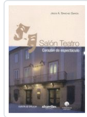
SALÓN TEATRO. CORAZÓN DO ESPECTÁCULO JESUS A.SANCHEZ GARCIA