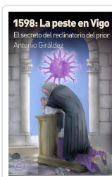
1598: LA PESTE EN VIGO ANTONIO GIRÁLDEZ