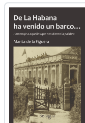
DE LA HABANA HA VENIDO UN BARCO... MARITA DE LA FIGUERA