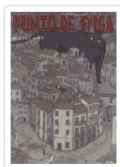
PUNTO DE FUGA MIGUEL CUBA