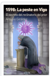
1598: LA PESTE EN VIGO ANTONIO GIRÁLDEZ