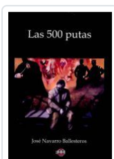
LAS 500 PUTAS JOSE NAVARRO BALLESTEROS