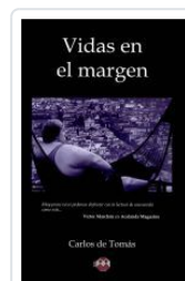
VIDAS EN EL MARGEN CARLOS DE TOMAS