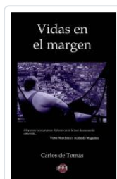
VIDAS EN EL MARGEN CARLOS DE TOMAS