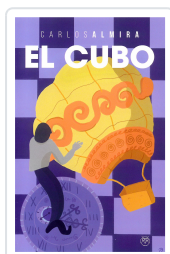
EL CUBO CARLOS ALMIRA