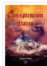
CONSPIRACION DIVINA ANGELES MOLINA