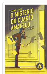
O MISTERIO DO CUARTO AMARELO LEROUX, GASTON