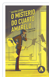
O MISTERIO DO CUARTO AMARELO LEROUX, GASTON