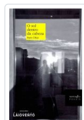
O SOL DENTRO DA CABEZA SUSO DIAZ