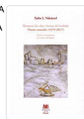
MEMORIA DOS DÍAS, FORMAS DA LEVIDADE. (T. BLANDA) XULIO L. VALCARCEL