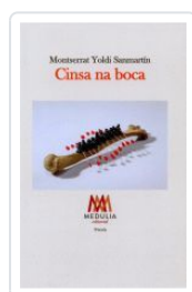
CINSA NA BOCA MONTSERRAT YOLDI SANMARTÍN