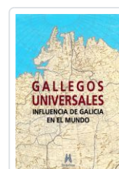
GALLEGOS UNIVERSALES VV.AA.:ALFONSO EIRE(COORD.)