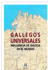
GALLEGOS UNIVERSALES VV.AA.:ALFONSO EIRE(COORD.)