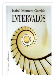
INTERVALOS ISABEL MONTERO GARRIDO