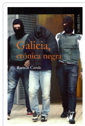
GALICIA, CRÓNICA NEGRA RAMÓN CARIDE