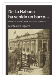
DE LA HABANA HA VENIDO UN BARCO... MARITA DE LA FIGUERA