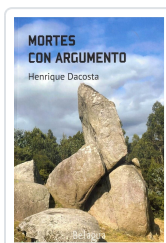
MORTES CON ARGUMENTO HENRIQUE DACOSTA