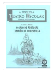
O GALO DE PORTUGAL CAMIÑO DE COMPOSTELA. A PINGUELA 86 CARLOS LABRAÑA