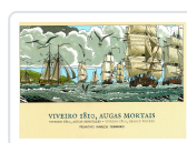
VIVEIRO 1810, AUGAS MORTAIS PRIMITIVO MARCOS FERREIRO