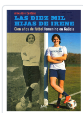
LAS DIEZ MIL HIJAS DE IRENE ALEXANDRE CENTENO