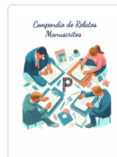
COMPENDIO DE RELATOS MANUSCRITOS VV.AA.