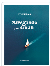
NAVIGANDO POR ANIÁN ANXO MUÍÑOS