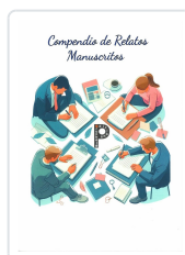
COMPENDIO DE RELATOS MANUSCRITOS VV.AA.