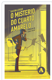
O MISTERIO DO CUARTO AMARELO LEROUX, GASTON