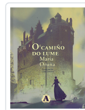
O CAMIÑO DO LUME ORUÑA, MARÍA