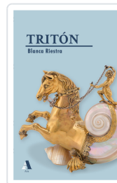
TRITÓN BLANCA RIESTRA