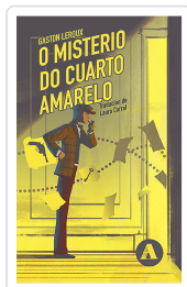
O MISTERIO DO CUARTO AMARELO LEROUX, GASTON