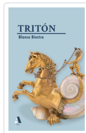
TRITÓN BLANCA RIESTRA