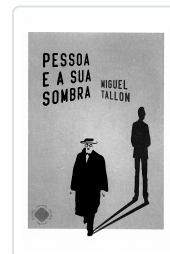
PESSOA E A SU SOMBRA MIGUEL TALLÓN