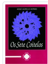
OS SETE COITELOS XOSE AGRELO HERMO