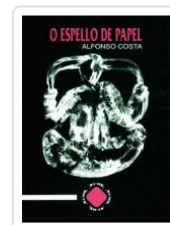
O ESPELLO DE PAPEL ALFONSO COSTA