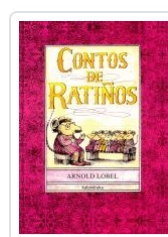
CONTOS DE RATINOS ARNOLD LOBEL