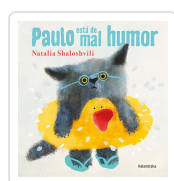
PAULO ESTÁ DE MAL HUMOR (Galego) NATALIA SHALOSHVILI