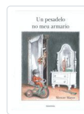
UN PESADEIRO NO MEU ARMARIO MAYER, MERCER