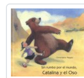
CATALINA Y EL OSO, SIN RUMBO POR EL MUNDO PIEPER, CHRISTIANE