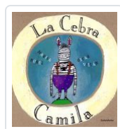
LA CEBRA CAMILA(26ª EDICIÓN) MARISA NÚÑEZ, OSCAR VILLAN(ILU.)