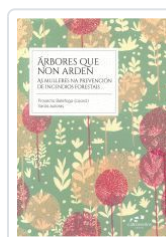
ARBORES QUE NON ARDEN PROXECTO BATEFOGO (COORD.)JARIAS AUTORAS