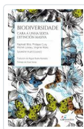
BIODIVERSIDADE. CARA A UNHA SEXTA EXTINCIÓN MASIVA RAPHAEL BILLE;PHILIPPE CURY;MICHEL LOREA