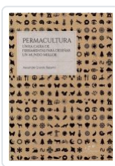
PERMACULTURA ALEXANDRE GRANDE BABARRO