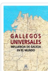
GALLEGOS UNIVERSALES VV.AA.: ALFONSO EIRE (COORD.)