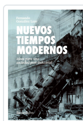
NUEVOS TIEMPOS MODERNOS FERNANDO GONZÁLEZ LAXE