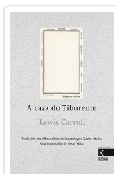
A CAZA DO TIBURENTE LEWIS CARROLL