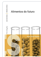
ALIMENTOS DO FUTURO JESÚS SIMAL GÁNDARA