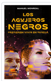
LOS AGUJEROS NEGROS PREFIEREN VIVIR EN PAREJA MANUEL MONREAL